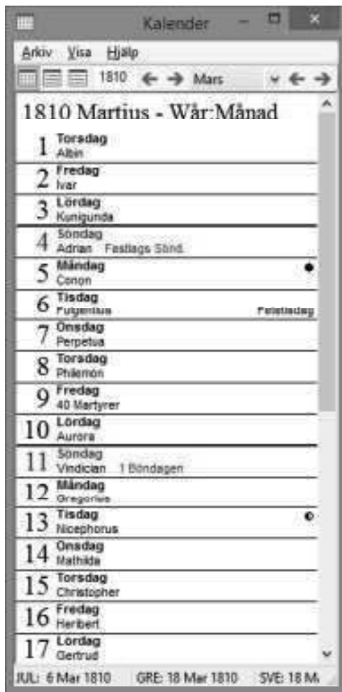
Bild 4. Kalender

Dannbergs Data Org nr: 570409-3995 (Godkänd för F-skatt)