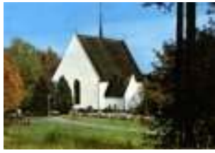
Grundsunda församling 1700-1920

Grundsunda församling 1700-1920 Pris: 170 kr + frakt